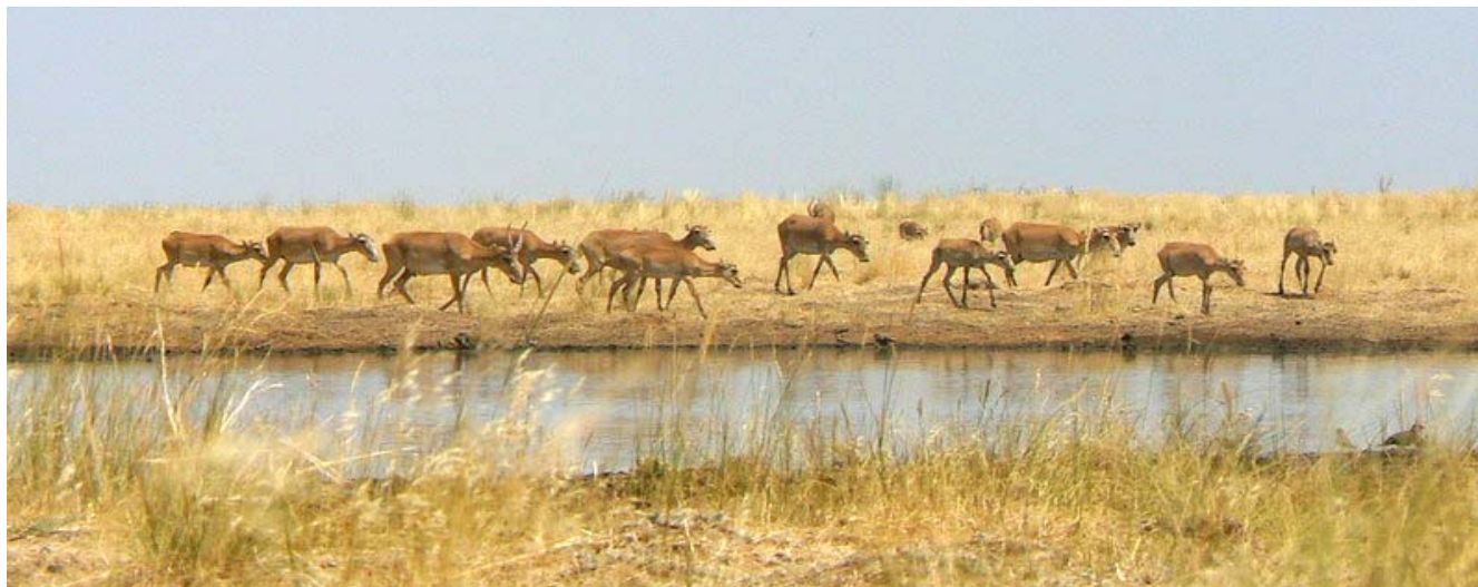
«Степной» қорықшасындағы (Ресей) ақбөкендер.

Сіз ол туралы мәліметтерді және мәлімдеме формасын мына сайттан www.saiga-conservation.com немесе электрондық почта esipov@sarkor.uz және saigaconservationalliance@yahoo.co.uk . Мәлімдемені (заявки) 2008 жылдың 30-шы қыркүйегіне дейін беруге болады. Проекттің ұзақтығы – бір жыл, 2008 жылдың 15 қарашасынан басталады.