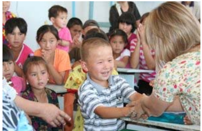
Құбыла-Үстірт поселкасында жеңімпаздарды марапаттау.

Қосымша мәліметті Е.Быкова мен А.Есупов береді: esipov@sarkor.uz .