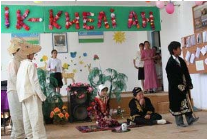
Жаслық поселкасындағы ақбөкен туралы қойылым (спектакль).

Біраздан бері ақбөкенді сақтау Альянсының Өзбекстан командасы жабайы табиғатты қорғау ұйымының (WCN) қаржысымен Үстірттегі балаларды оқыту программасымен жұмыс істейді. Ақбөкенді сақтау программасына ақбөкенге көбірек браконьерлік жасайтын Жаслық пен Қарақалпакия қыстақтарының үш мектебінің мұғалімдері, балалар және олардың ата – аналары қатысады. Сондай-ақ біз Үстірттің шығыс қыратында орналасқан, баруға алыс жаңа поселка Құбыла-Үстірттегі мектеп оқушыларын қатыстыру арқылы программаны кеңейттік. Биылғы жылдың наурыз-сәуір айларында мектептерде ақбөкенге арналған спектаклдер көрсетілді. Оларды көрсетер алдында балалардың, педагогтардың және тіпті олардың ата-аналарының творчестволық жұмыстары көрсетілді. Балалар ақбөкенге арналған ертегілер, новеллалар, өлеңдер жазды. Олардың ішіндегі ең таңдаулыларын жюри мүшелері таңдап алды және оларды ақбөкен туралы спектаклдердің сценарияларын жазуға пайдаланды. Мектептер дайындаған қойылымдар бір-біріне