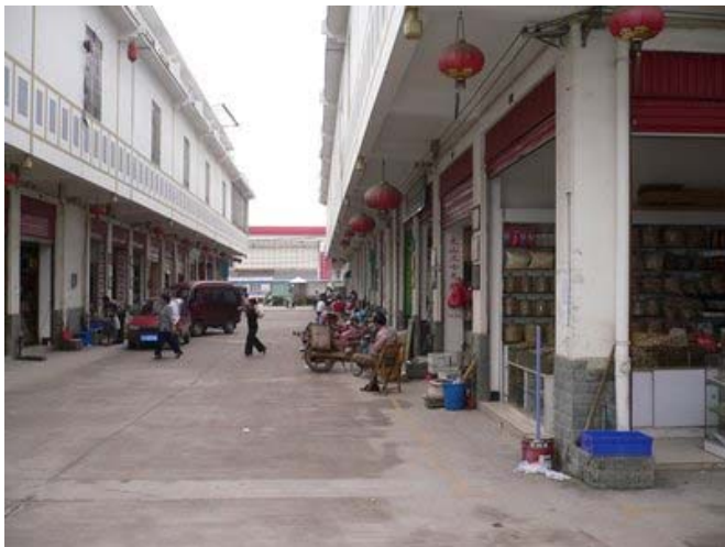
Дәстүрлі Қытай медицинасының базары.

Қабылданған ереже Панголина (қытай ящеры) мен сирек жыландар түрлерінің сандарының тез азаюына, сондай-ақ «ақбөкен мүйіздерінің дәстүрлік медицина (TCM) үшін жетіспеуі және контрабанданың мезгіл-мезгіл өсуіне байланысты болды; халықаралық қауымдастықтың жағынан проблема туғызды. СИТЕС мен МСОП ақбөкенді сақтау жөніндегі резолюцияны Қытай жағына берді және оны басқаруды күшейтіп, резолюцияның орындалуын талап етті».