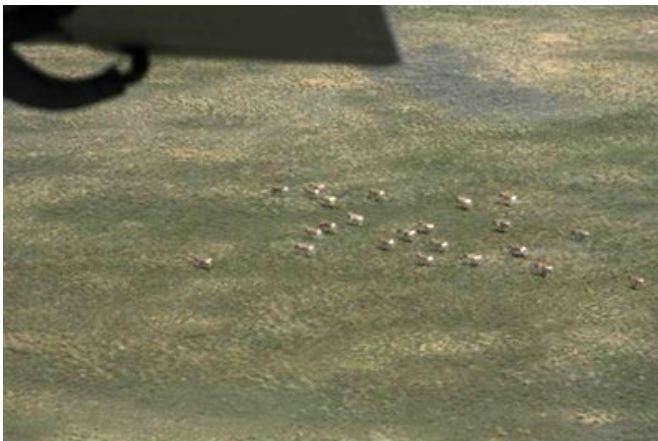
Ақбөкендерді самолеттен суретке түсіру.

популяциясы – 18,3 мыңдай болды. 2007 жылмен салыстырғанда, ақбөкеннің жалпы саны 11,3%-ке өсті. Бірақ үстірт популяциясының саны азайғаны байқалды. Осы уақытқа дейін санақ кезінде Өзбекстанда қанша ақбөкен қалатыны әлі белгісіз болып отыр? Әрине әр жылдары ауа райына байланысты аңның саны өзгеріп отыратыны белгілі ғой. Бұл мәселені шешу үшін екі елде де бір мезгілде ақбөкенге санақ жұмысын жүргізу қажет. Қосымша мәліметтерді Ю.А.Грачевтан, Институт зоология (Қазақстан), terio@nursat.kz алуға болады.