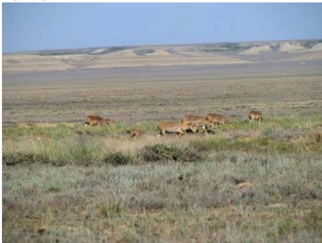
Бетпақдалада ақбөкендер төлдеу кезінде.

Қазірде 61 мыңдай ақбөкен бар деп есептеледі. Деседе, ақбөкеннің Үстірт популяциясының саны азайып келеді. Өткен жылы оның саны 15 мыңдай болса, ал биыл бұл көрсеткіш тек 10 мыңдай ғана. Маман-зоологтар оның басты себебі – қыста ақбөкендер Өзбекстан мен Түркменстан территорияларына қоныс аударады. Онда оларды қорғау мардымсыз. Оны біздің көршілерімізде мойындайды.