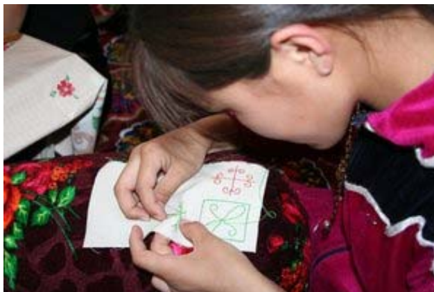
Жаслық поселкасында дәстүрлі кесте тігуге үйренудің алғашқы сабақтары.

Мұндай проекттіні жүзеге асыру онша күрделі құрал-жабдықтарды және көп қаржыны қажет етпейді; кез-келген өнерге жақын әйелдер мұндай жұмысты үйлерінде істеуге болады. Аталған проект мерзімі бір жыл және Жаслық поселкасында жүзеге асуға тиіс. Арнаулы үйде үйренуге тырысқан әйелдерді жинап, кесте тігу техникасы туралы сабақтар өткізіп, жергілікті басшыны сайлап, жұмысқа кірісуге шақырдық Алғашқы сапалы өнімде дайын болды. Келелекте кестеге күрделі элементтерді салуға үйрету жалғасады. Дайын болған кестелерді алғашқы тәжірибе есебінде сату өткізілді. Біз сондай-ақ ақбөкенді сақтау идеясын насихаттау үшін кестеге тігуге керекті ақбөкен бейнесін суреттеуді жоспарладық. Қосымша мәлімет алу үшін Е.Быковаға, esipov@sarkor.uz және Г.Ембергеноваға, altynl@rol.uz хабарлауға болады.