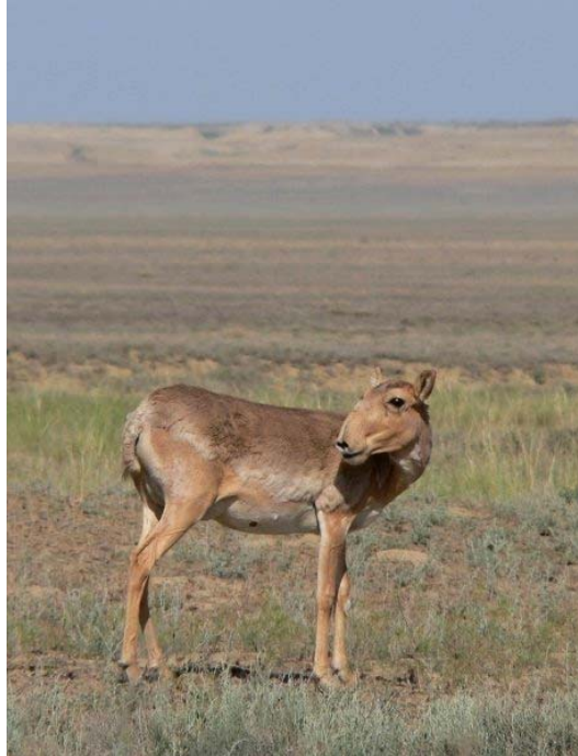
Бетпақдалада ақбөкен аналығы төлдеу кезінде.

Табиғатты қорғау инициативасы «Алтын-Дала» (ADCI) – солтүстік дала мен шөлейтті экосистемаларды және қазіргі жағдайлары өте қиын ақбөкен ( Saiga tatarica tatarica ) немесе тарғақ ( Vanellus gregarius ) сияқты жануарларды қорғауға арналған кеңкөлемді жоба (проект) болып табылады.