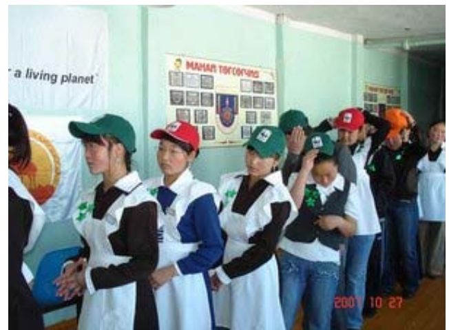
Балалар эко-клубы – білім беру программасының бір бөлігі.