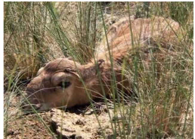
Бетпақдаладағы ақбөкен құралайы. 2008 ж. көктемі

Бұл Меморандумға мынадай тиімді орындалуы үшін Қазақстан, Ресей, Өзбекстан және Түркменстан арасында екі жақты келісім қажет. 2007 ж. мамыр айында Қазақстан Үкіметі атынан ҚР-ның ауыл шаруашылығы Министрлігі осындай келісімге Түркменстан Үкіметімен қол қойылды. Әсіресе, Өзбекстанға қоныс аударатын үстірт популяциясы үлкен проблема тудыруда; өйткені мұнда ақбөкенді қорғау мен санақ жұмысын жүргізуде бірлескен шаралар қолдануды керек етіп атыр. Осыған байланысты Комитет екіжақты Үкіметаралық ақбөкеннің үстірт популяциясын сақтау жөніндегі келісімнің проектiсiн дайындады; сондай келісім жобасы Орал популяциясы туралы Қазақстан мен Ресей арасында да дайындалды. Бұл документтер белгілі тәртіппен Ресей Федерациясы мен Өзбекстанға жіберілді. Аталған келісімге қол қою 2008 ж. жүзеге асуға тиіс.