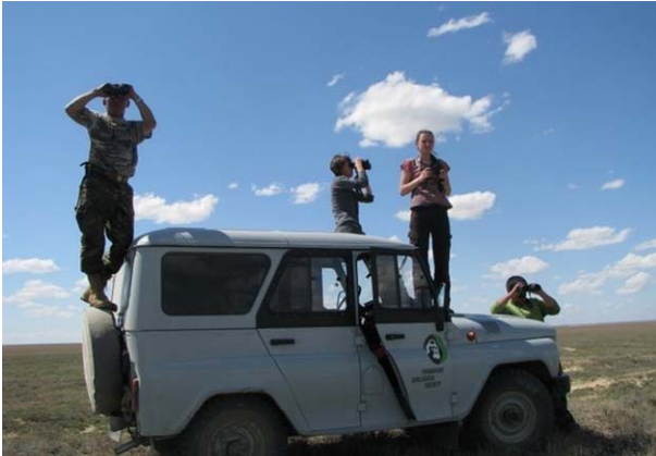
ADCI командасы Бетпақдалада зерттеулер жүргізуде.

Ақбөкенді сақтау: «Алтын-Дала» инициативасы инспекторлардың үш тобын құрды, оларды автокөлікпен, палаткалармен, бинокльдермен және басқа да құрал-жабдықтармен қамтамасыз етті. Олар экспедиция жағдайында инспекторлардың мемлекеттік бригадаларына көмектеседі; проектiнiң мониторинг системасы үшін негiзгi түрлер туралы мәліметтер жинайды, сонымен бірге мектеп оқушыларымен, жергілікті беделді адамдармен («Совет старейшин») жұмыс жүргізеді. Негізгі мақсат – жастарды браконьерлік жолға түсірмеу.