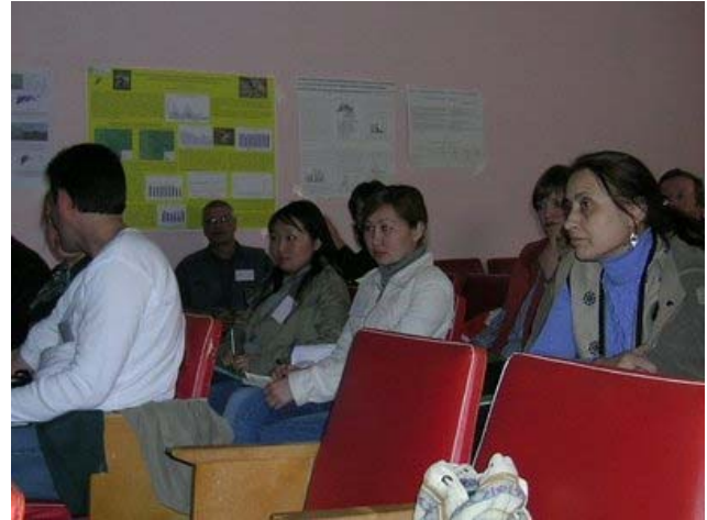
Халықаралық мектеп-семинарға қатысушылар.