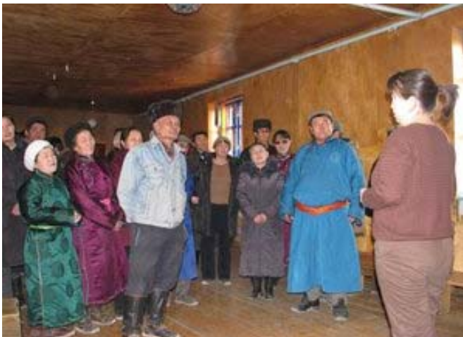
Малшылар қауымы социальдық сұрақтарды талдауға қатысуда.

алты эко-клуб ашу белгіленген. Негізгі өзгеріс-заңдылық базасына өзгеріс енгізу болды, бұл өз жемісін берді; браконьерлер мен күресу командасы аналық ақбөкенді және үш құланды ұстаған браконьерлерді 2007 жылдың қараша айында ұстаған, сондай-ақ 2008 ж. наурызында бір барысты атқан браконьер қолға түскен. Бұл жағдайларды заң қорғау органдары тексеруде.