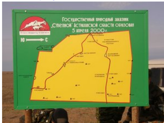
«Степной» қорықшасындағы экологиялық жолдар схемасы. Сурет А. Хлудневтікі

Қосымша мәліметтерді алу үшін А.В.Хлудневпен хабару қажет, limstepnoi@mail.ru .