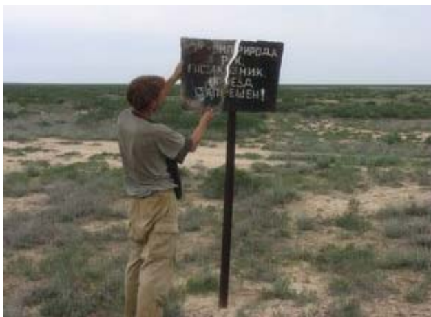
Қорықшадағы бүлінген аңшылақ.

«Ақбөкен» қорықшасы 1991 жылы (жер көлемі - 1 млн. га) ақбөкеннің қоныстарын қорғау мақсатында құрылған. Қорғалатын территорияның мұндай формасы жұмыс істемейді, өйткені штаты, инфраструктурасы, көліктері және т.б. жоқ. Қорықша маңында тұратын жергілікті тұрғындар ол туралы ештеңе білмейді. Сол себепті «Ақбөкен қорықшасын» қазіргі табиғи территорияны қорғаудың тиімді формасына сәйкес қайта құру керектігі күн тәртібінде тұрды. 2008 ж. сәуір айында ақбөкенді сақтау Альянсы, Өзбекстанның Зоология институты және Фауна мен Флора халықаралық ұйымы Disney Wildlife Foundation және WildInvest ұйымдарының қаржыландыруымен қорықшаны қайта ұйымдастыру проектісін дайындауға кірісті. Жобаны жасаушы команда бұл проектті «қағаз жүзінде қалатын қорғалатын табиғи территория» емес нағыз Өзбекстан мен көршілес елдер территорияларында ақбөкеннің Үстірт популяциясын тиімді қорғалатын территорияға айналуды тиіс.