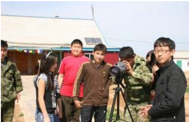
Яшкөл питомнигіне мектеп оқушыларының экскурсиясы.

Ақбөкен питомнигі – қаладан және тас жолдан алыс орналасқанына қарамастан, жергілікті тұрғындар арасында үлкен сенімге ие. Бір жылда оны 120 адам көрді. Қонақтар арасында мектеп оқушылары, өнеркәсіптер мен ұйымдардың қызметкерлері, ғалымдар болды. Әсіресе, келгендер үшін қызықтысы ақбөкен тобын көру болды. Жануарларды шошытпас үшін оларды бақылау арнаулы жабдықталған шықпадан жүзеге асырылады. Бұл шара антилопаға осындай бақылау олардың дағдырын сақтап қалу жөнінде адамдар арасында жауапкершілік сезімін тудырады. Білмейтінді және белгісіздерді сүю және сақтау мүмкін емес. Питомникке барғандарға экскурсовод қызықты әңгімелер айтып береді. Келушілер үшін «Мен туралы бәрін білесің бе?», «Ақбөкенді