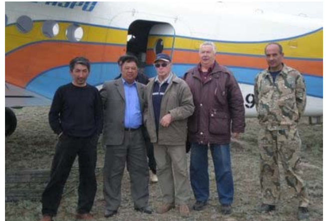
Охотзоопром мен Зоология институтының қызметкерлері ақбөкеннің Орал популяциясын санау үстінде.