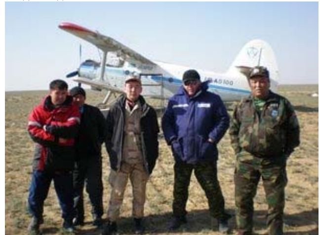
Ақбөкеннің үстірт популяциясына санақ жүргізу кезінде «Охотзоопром» инспекторлары Бозой поселкасы маңындағы далалық аэродромда. 2008 ж. көктемі.

асырады. Оның 83 инспекторлардан тұратын 9 мобильный группасы вахталық әдіспен жұмыс істейді. Олар 43 кезкелген жолмен жүре алатын жақсы автокөлікпен, 4 спорттық мотоциклмен жабдықталған. Сондай-ақ жануарларды қорғауға облыстық орман және аңшылық шаруашылығының территориялық Басқармаларының мемлекеттік инспекторлары және құқық қорғау органдарының қызметкерлері де қатысады. Қорғауға жұмылдырылған группалар мылтықтармен, жердің жасанды серігі арқылы хабарласатын телефондармен, видео – және фотокамералармен, мобильный радиостанциялармен жабдықталған. Қазірде РГКП «ПО «Охотзоопром» сатып алған «Ми-2» вертолеті (тік ұшқыш) ақбөкендерді қорғауға пайдаланады.