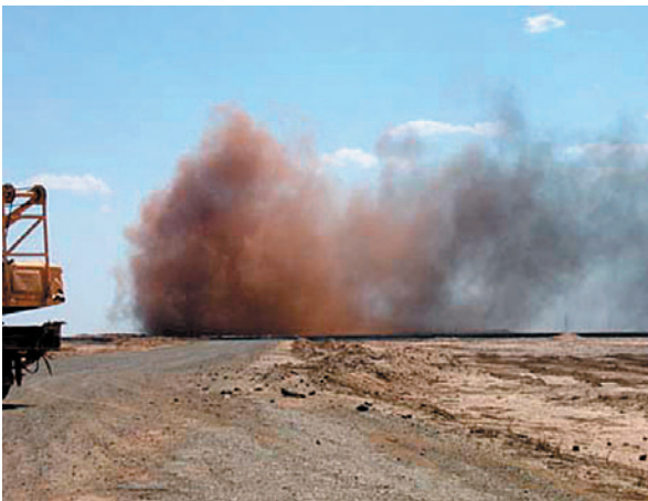
Тулэй хийн баазын ойролцоох хийн дэлбэрэлт.

Узбекистан улс байгалийн хийн нөөцөөрөө дэлхийд 8-р байр эзэлдэг. Нийт 2.44 триллион куб.м байгалийн хийн нөөцтэйгээс 1.7 триллион куб.м-нь Устюртад байдаг. Энэхүү тэгш өндөрлөг газар 250 зүйл сээртэн амьтад бүхий бахархмаар хосгүй байгалийн баялагтай. Эдгээрийн түлхүүр зүйл амьтдын нэг бол бөхөн юм. Энэхүү нутаг маш алслагдмал, эдийн засгийн хөгжлийн төвшин доогуур, харьцангуй бага хөндөгдсөн хосгүй экосистемтэй. Хэдий тийм ч “Арал” далайн байгалийн гамшиг нь эдийн засгийн хүнд нөхцөл байдлыг хүмүүсийн амьдралын түвшинг доройтуулах замаар улам дордуулж, улмаар ажилгүйдэл үүсч энэ нь зэрлэг байгальд халдах гол шалтгаан болсон. Ялангуяа бөхөнг хулгайгаар агнах явдал эрс ихэссэн. Гэсэн хэдий ч бөхөнгийн хувьд хулгайн ан бол дан ганц аюул занал биш юм. Орос, Узбекистаны хамтарсан төслүүдийн хэрэгжилтээр орон нутгийн эрчим хүчний салбарын хөгжил дээшилж байгаа бөгөөд энэ нь бөхөнгийн популяцид учирч болох боломжит аюул занал юм.