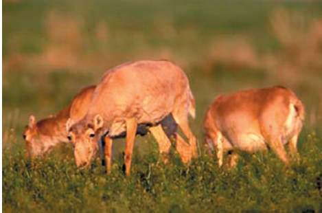
Зураг. Билчээрлэж буй шаргачин.

Казакстан: “Казакстанская правда” сонин, Дугаар 88-89, 2006 оны 4 сарын 14.